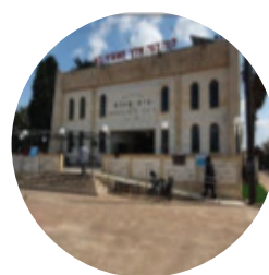
בית הכנסת בית מנחם