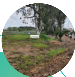
חלקה 126 בכניסה לכפ"ח